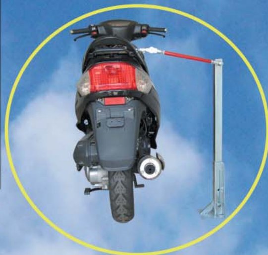
Standfuss mit Greifklaue für Gepäckträger