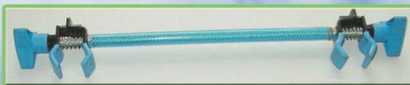
Doppelhaltearm für die Befestigung zwischen zwei Fahrrädern