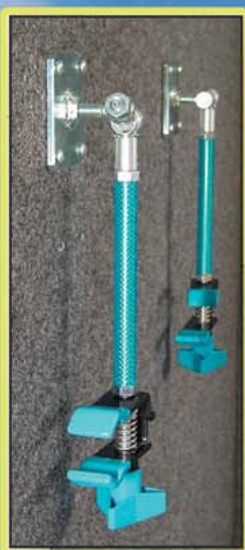
Greifklaue mit Wandbefestigung